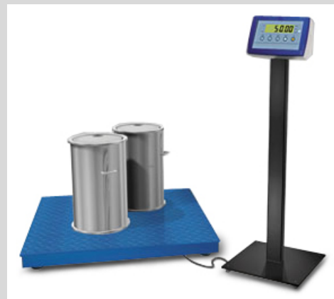
Bodenwaage + optionales Stativ

Multifunktionelle Bodenwaage, einfache Handhabung, leistungsstark für den professionellen Einsatz in Industrie und Handel. Standardausführung entsprechend den OIML R-76 / EN 45501 Richtlinien. Verfügbar auch in eichfähigen Versionen